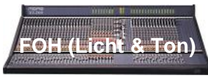
FOH (Licht & Ton)